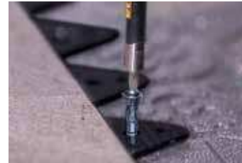
Hauteur de la bordure 15 mm (5/8 po)