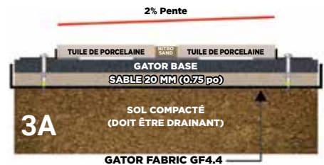
COUPE TYPE D'UNE INSTALLATION DU SYSTÈME GATOR TILE